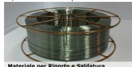
Materiale per Riporto e Saldatura